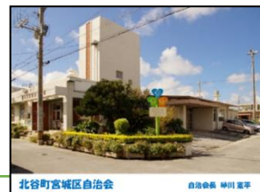
北谷町宮城区自治会